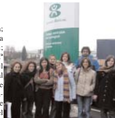
IES Montserrat Roig de Terrasa. Catalunya.

Entre todos, visitaron los talleres de Markina, Sestao, Etxebarri y Erandio y Loiu.