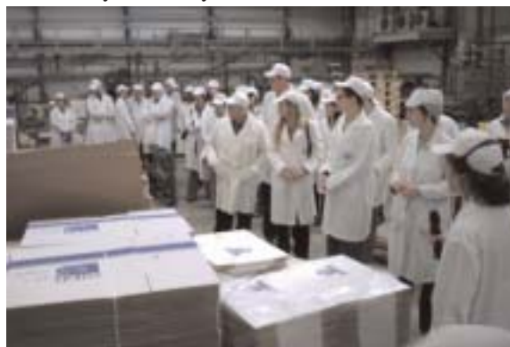
Los Socios Europeos en el programa EQUAL - Zabalan visitaron la empresa conservera Salica, que ha contratado a siete personas con discapacidad intelectual.