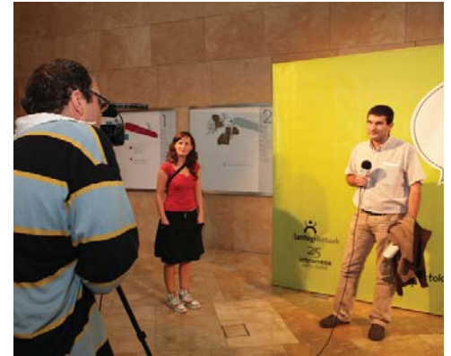
Durante el cocktail los asistentes respondieron a la pregunta: ¿qué es para ti trabajo?