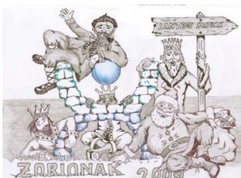
Postal de Julen Uribarri